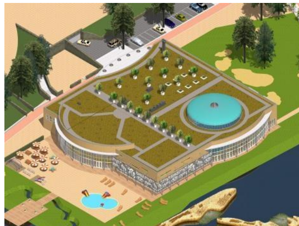
zwembad Binnensee in Noordwijk