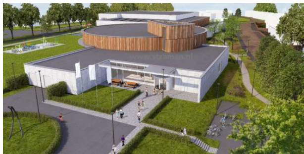
zwembad Aquamar in Katwijk aan Zee